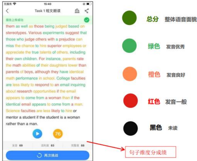
(图 2 智能评测)