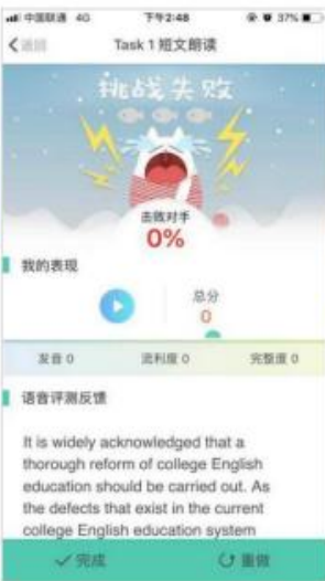
(图 36 挑战失败)