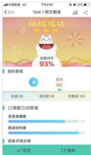
(图 35 挑战成功)