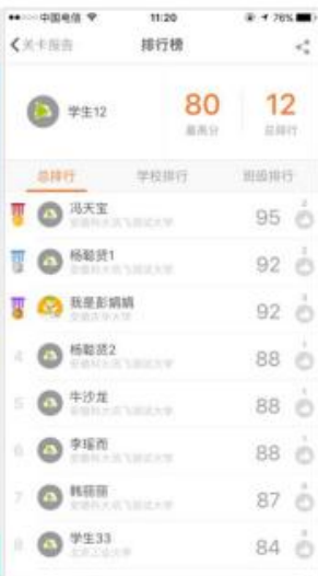
(图 37 排行榜)