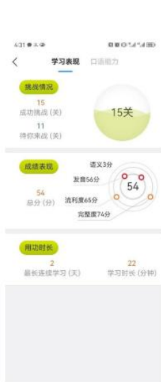
(图 127 学习表现)

点击【统计分析】，进入如图所示页面，查看学习表现以及口语能力情况统计。(图 127、128)。在学习表现页面可以查看整体的挑战情况：展示已成功挑战的关卡数与等待挑战的关卡数；口语成绩：展示完成挑战关卡成绩的平均分，和分维度的平均分统计图；用功时长：统计总学习时长以分钟为单位、连续学习天数和近 10 天学习时长柱形图；社交分享：统计送出的赞数、收到的赞数、分享次数。在口语能力页面，可以查看口语能力训练情况：展示用户在系统中总计获得的口语能力训练值；学习建议：依据用户的口语能力预测分，给出合理的学习建议；口语能力预测分：依据用户在系统中获得口语能力训练值的情况，计算出预测分数；PK 功能：可以将自己的成绩与历史中的自己或者其他用户进行比较，了解自己的口语能力水平。