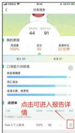
(图 1 任务报告)

点击“教师任务-已完成”中的“任务报告”按钮，或“任务详情”页面的“任务报告”按钮，进入某任务的“任务报告”页面，查看该任务的班级排名、班级平均分、完成度、个人总分、录音时长、分维度分数、口语能力训练值以及任务中每个课程的表现。（图 1）