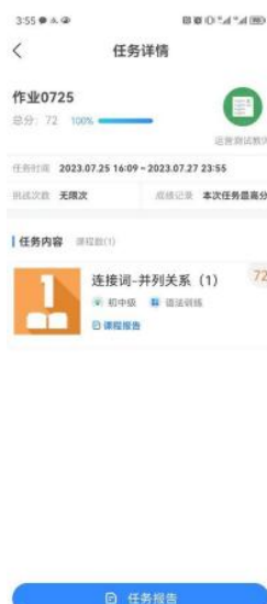
(图 11 任务详情)

点击“AI 任务-进行中/已完成”列表中的任务，即可进入“任务详情”页面（见图 11）。“任务详情”页面包含三部分信息，任务基本信息、任务说明和任务内容。任务基本信息：教师头像、教师名称、任务名称、任务完成度、任务开始时间、结束时间和任务倒计时。任务内容：课程信息与“自主学习”中的课程信息相同。“教师任务-已完成”的“任务详情”页面会有“课程报告”按钮，点击可查看个人的任务表现。