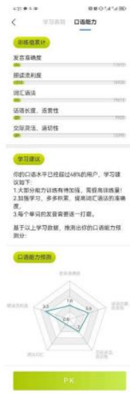
(图 128 口语能力)