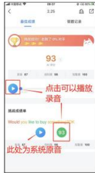
(图 1 任务报告)

3.3.3 单词标色颜色注释 FiF 口语训练系统基于科大讯飞国际领先的智能语音技术而研发，所有题型均实现了即时机评反馈，且反馈形式多样化。不仅提供单句的总成绩和分维度成绩，还能够对句子进行单词标色。标色规则为：红色为发音一般、橘色为发音良好、绿色为发音优秀、黑色为未读。学生可依据反馈结果，更有针对性的加强口语练习。